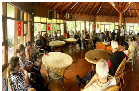
UĞUR MUMCU MAH