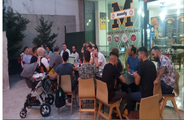
PENDİK ESENYALI MAH.